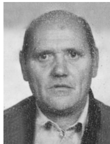
Luigi Boldini 1° anniversario