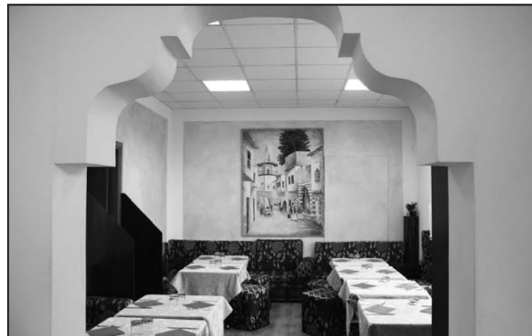
Ristorante tipico siriano con prodotti biologici.

PIATTI PER VEGETARIANI E VEGANI DOLCI TIPICI SIRIANI E VEGANI