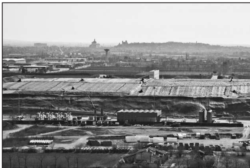
Un "profilo" di Montichiari.

P.S. Per chi volesse saperne di più si veda la stampa nazionale e locale dal giorno 8 gennaio 2014.