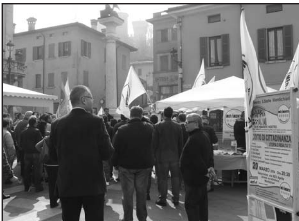
L'intervento M5S in Piazza S. Maria.

Una nuova presenza a Montichiari del Movimento 5 Stelle è previsto per GIOVEDÌ 20