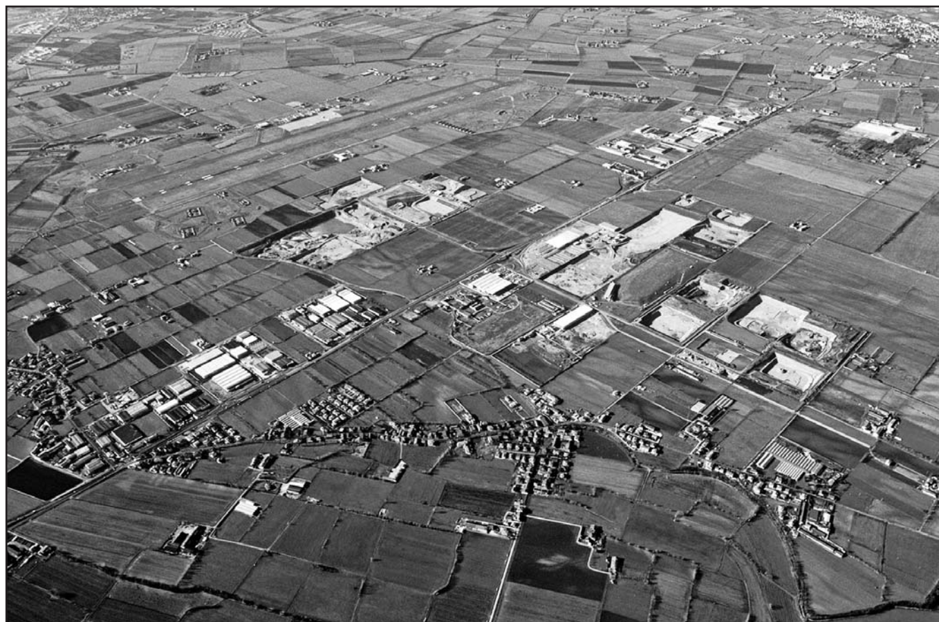
Vighizzolo visto dall'alto.

BRESCIANA CHE GESTISCE ECOSERVIZI, VALSECO E ALTRI CINQUE IMPIANTI E CHE RISULTA DI PROPRIETÀ DI CINQUE AZIENDE ROMANE CHE FANNO CAPO AL GRUPPO CERRONI,