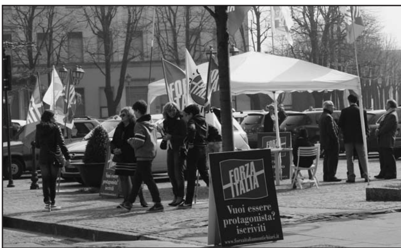
Il gazebo di Forza Italia in Piazza Treccani.

Nulla di definito per quanto riguarda alleanze e strategie per il candidato sindaco. L'aggregazione di tutto il centro destra sembra una ipotesi non completamente realizzabile e l'alleanza con la Lega Nord e civiche della passata elezioni è ancora in discussione.