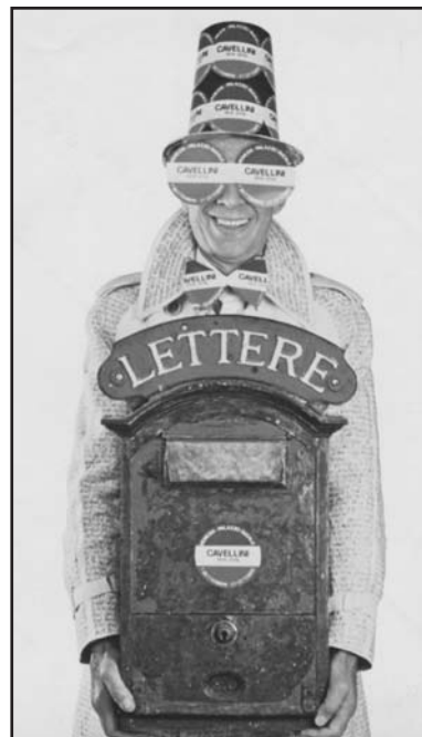
L'autoritratto di Cavellini.

Enrico Mirani (Giornale di Brescia 14 marzo 2014)