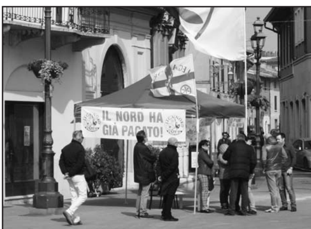
Il gazebo della Lega Nord.

Fino ad ora nessuna novità rispetto alla varie ipotesi di cui abbiamo già riferito; alle elezioni amministrative deve essere indi-